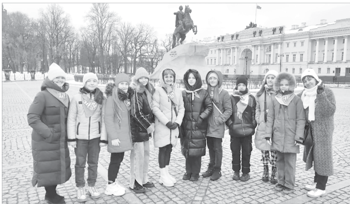
Делегация из Луганска на экскурсии по Санкт-Петербургу

– История школы началась ещё в СССР с 1968 года. В 1998 году она была переименована в Дет-