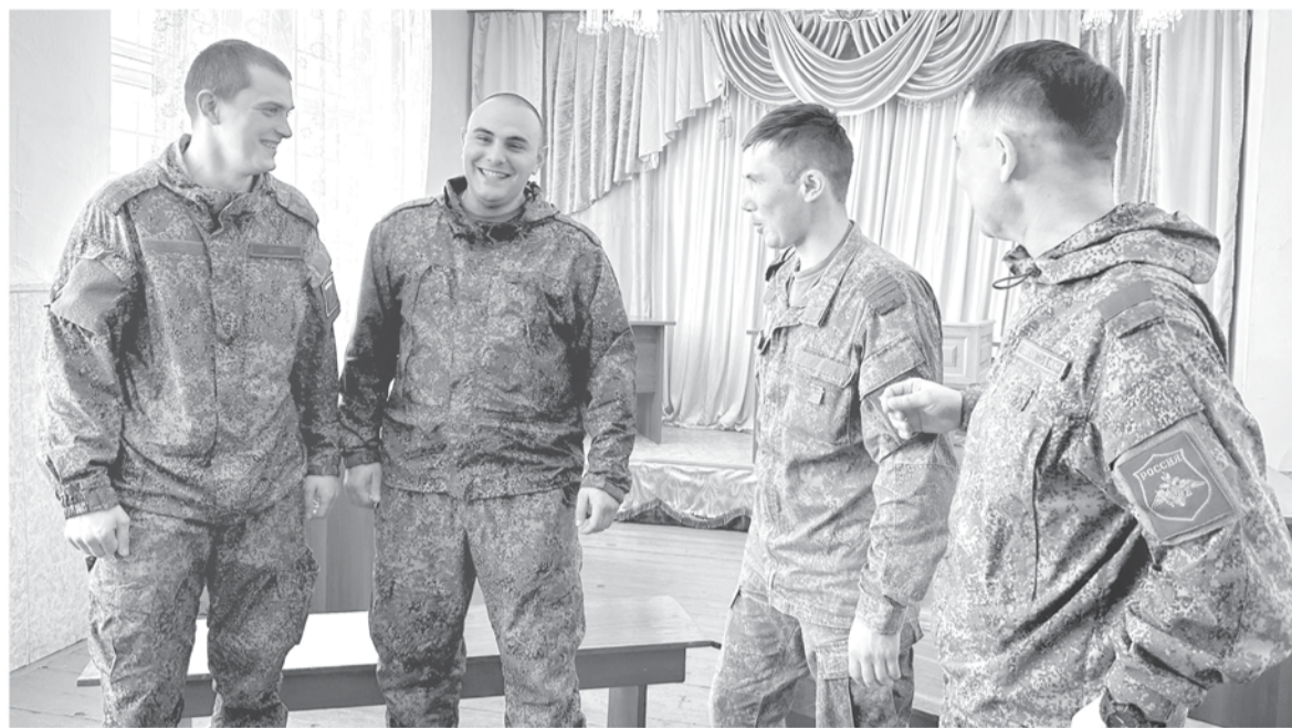
Дух боевого братства ветераны СВО сохранили и по возвращении с фронта

Бобёр любит повторять: «На передовой не страшно толь-