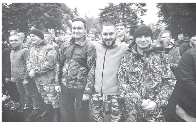
Меры поддержки доступны с момента поступления на службу