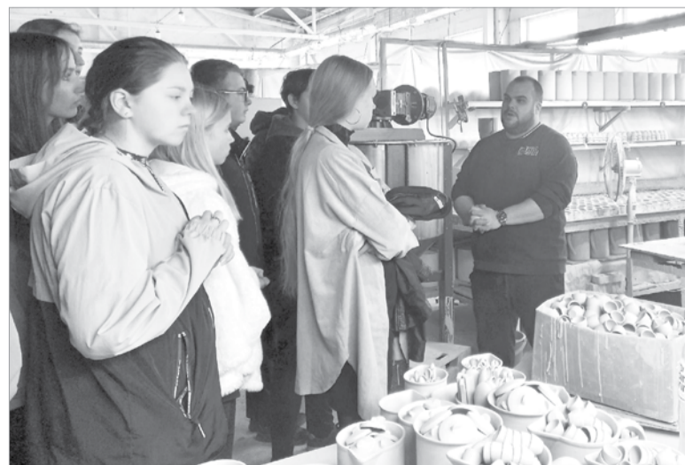
В «Оятской керамике» производят лабораторную и химическую посуду