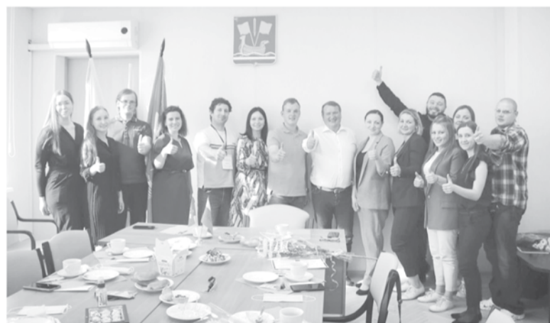
Штабы движения работают во всех районах Ленобласти