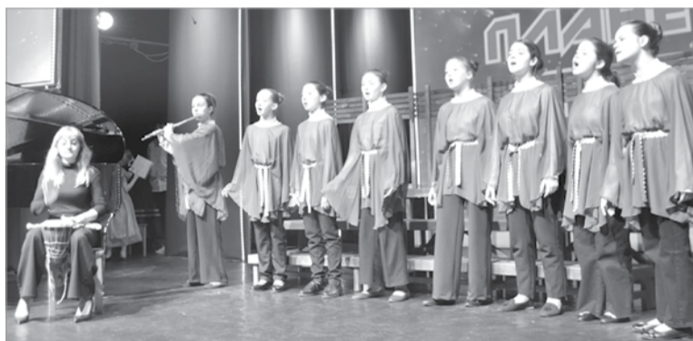
Ансамбль «Анима» на сцене фестиваля «Планета детства»

скую школу искусств № 1, далее в эти беспокойные и напряженные времена претерпела ряд реорганизаций. С 2019 года (и уже надеюсь навсегда) мы являемся государственным учреждением ЛНР «Луганское учреждение дополнительного образования – школа искусств № 1». В 2020 году лицензировались Министерством образования и науки ЛНР. Сейчас постепенно переходим на стандарты и требования РФ. Есть, конечно, сложности, ибо мы пока живем и работаем наполовину по стандартам ЛНР, наполовину – по РФ, но постепенно осваиваемся.