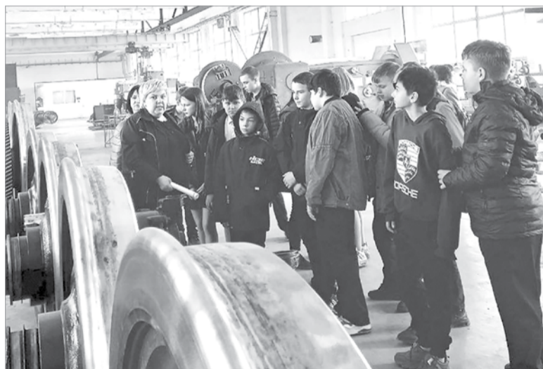
Здесь ремонтируют колёсные пары для локомотивов