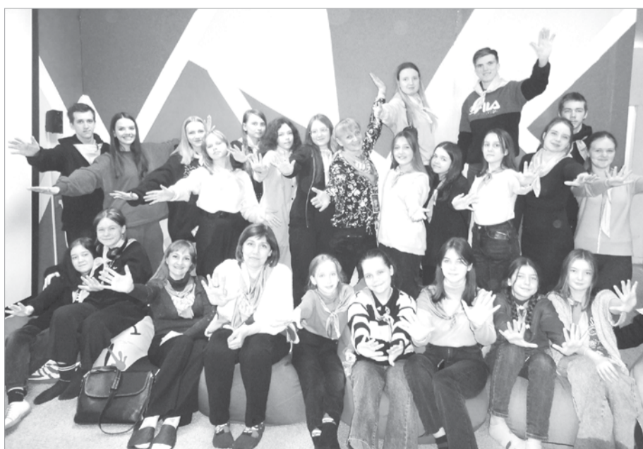
Встреча в антикафе «Хорошее место»