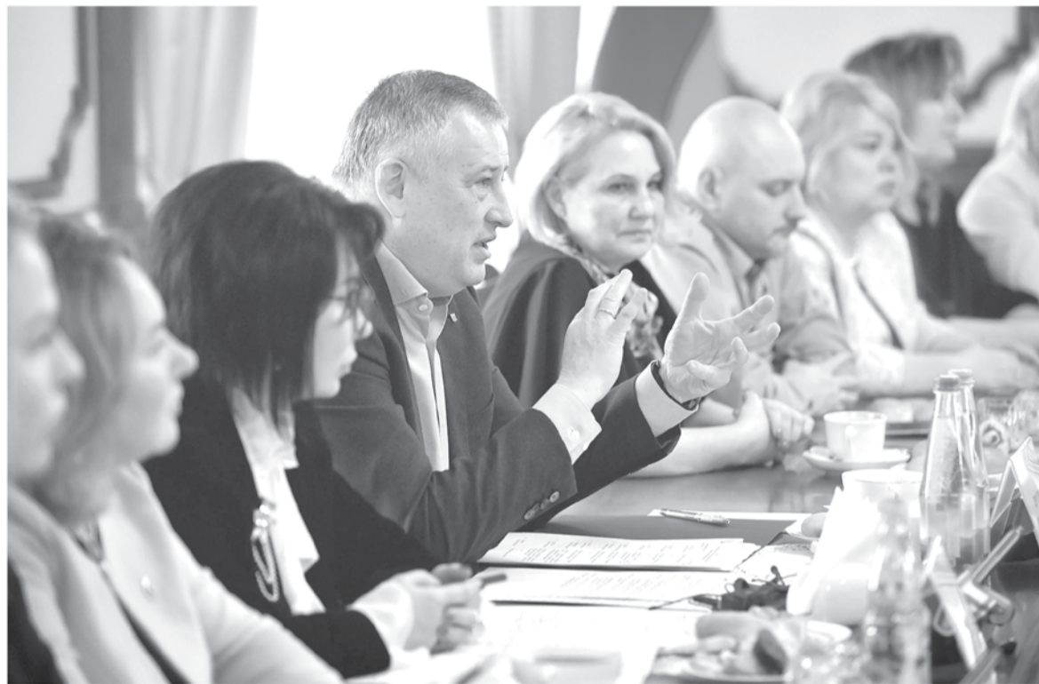
Руководство Ленинградской области на встрече с жёнами участников СВО

В ЛЕНИНГРАДСКОЙ ОБЛАСТИ ДЕЙСТВУЕТ 49 МЕР СОЦИАЛЬНОЙ ПОДДЕРЖКИ УЧАСТНИКОВ СВО И ИХ СЕМЕЙ