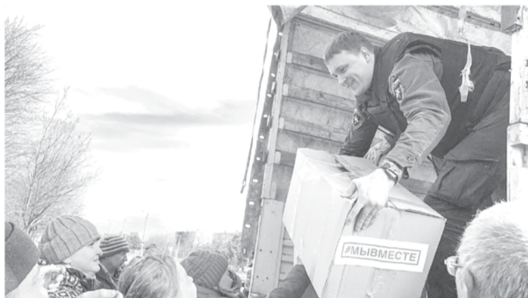
Волонтеры активно собирают помощь для наших защитников

Ещё одной востребованной мерой поддержки для семей мобилизованных стала губер-