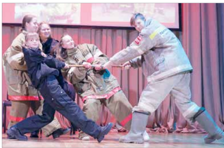
Поздравление – от дружины юных пожарных