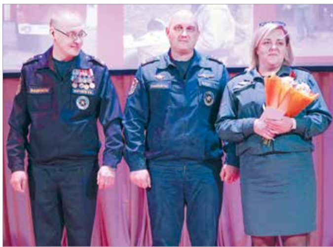
Пожарным вручили награды и подарки