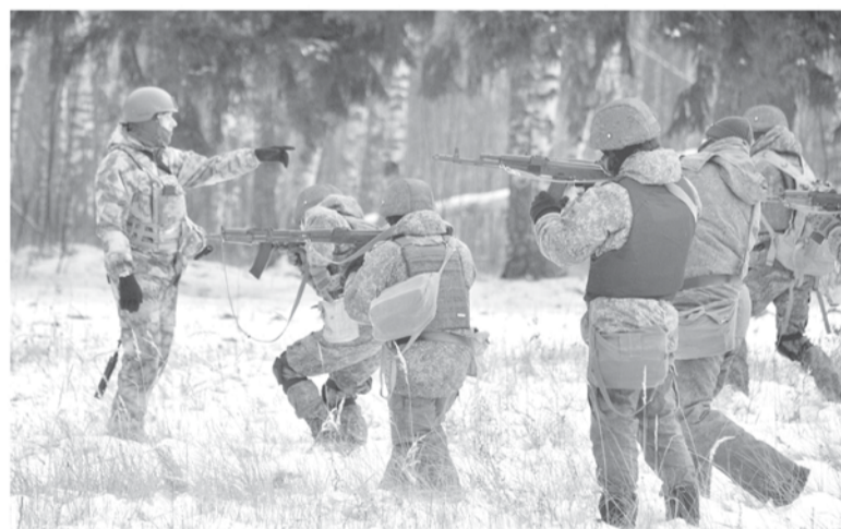
В Лужском районе бойцы проходят боевое слаживание перед отправкой на фронт